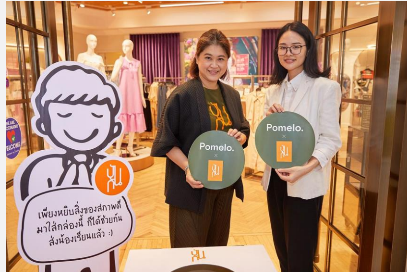
คลิกรูป อ่านเพิ่มเติม